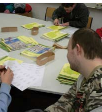
Unten: Die Lebenshilfe Imst hilft schon seit Jahren beim Etikettieren. Herzlichen Dank!