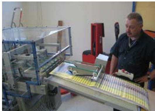
Oben: Von den Druckdaten zum fertigen Produkt ...